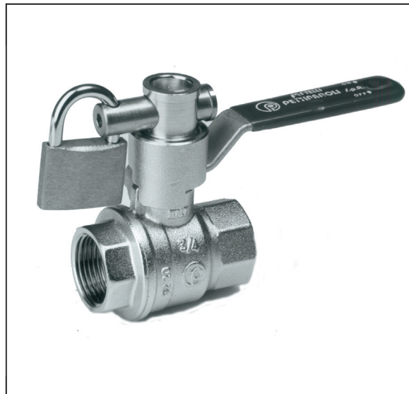
Lås ingår ej.