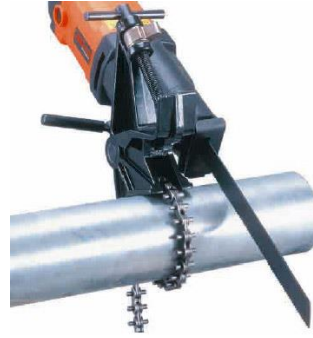
Kedjesidan av 2-i-1 rörskruvstycket för större dimensioner.