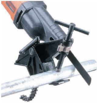
Snabbkopplingsidan av 2-i-1 rörskruvstycket för mindre dimensioner.

En världsnöhet: Ett rörskruvstycke med 2-i-1 funktion! På ena sidan finns en röredja för DN 15 till DN 150 rör. På andra sidan finns ett rörskruvstycke med snabbkoppling. Vid rörkapning med detta skruvstycke ökar hävstångskraften fyra gånger och skruvstycket ger perfekta 90 graders kapningar.